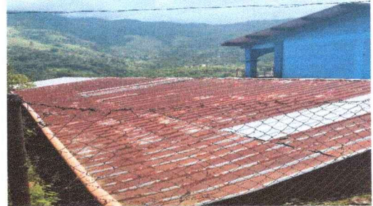
Foto 2: PARTE DEL ENTECHADO DE LAS AULAS Y DIRECCION QUE AMERITAN SUSTITUCION DE LAMINAS Y LIMPIEZA DE ESTRUCTURA POR OXIDACION