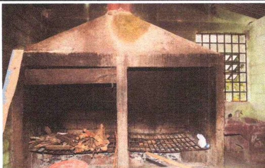
Foto 5: EL POLLETON DE LA COCINA ESTA DETEREORADO NECESITA LA RESTITUCION EN LAS PLANCHAS DE AMBOS LADOS.