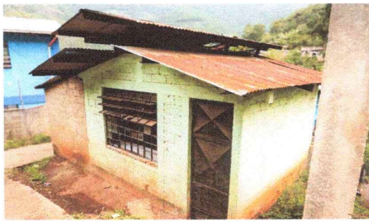
Foto 3: EL ENTECHADO DE LA COCINA NECESITA CAMBIOS DE LAMINA EN SU TOTALIDAD, REPELLO EN LA PARTE INTERIOR Y EXTERIOR