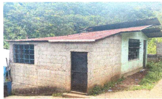
Foto 4: FOTOGRAFIA DE LA COCINA QUE NECESITA CAMBIO VISTA DESDE LA PARTE EXTERIOR DEL LADO ESTE.