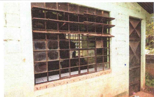
Foto 6: LAS VENTANAS DE LA COCINA NECESITA CAMBIO DE VIDRIOS VENTANA EXTEREOR E INTERIOR.

Observación: Si es necesario se pueden agregar hojas adicionales y actualizar el número de hojas.