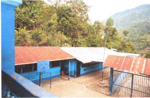
Foto 1: ENTECHADO DE LAS AULAS Y DIRECCION QUE NECESITA RESTITUCION DE LAS LAMINAS POR OXIDACION.